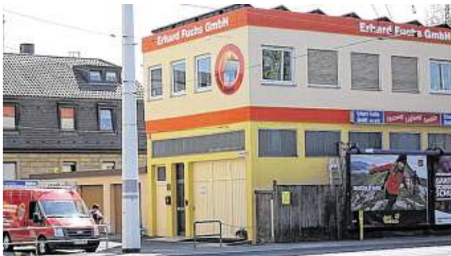
Die Firmenzentrale in der Hedanstraße.

Unter anderem sind dies die Ehrenurkunde des bayerischen Wirtschaftsministeriums für Verdienste um die Ausbildung in der gewerblichen Wirtschaft, der Goldene Meisterbrief der Handwerkskammer für Unterfranken und die Ehrenurkunde für die lange Mitarbeit in der SHK-Innung. fcn